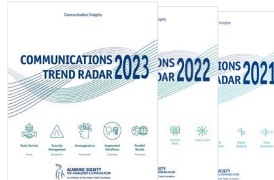
Communications Trend Radar (Jan 23 - Feb 2024)