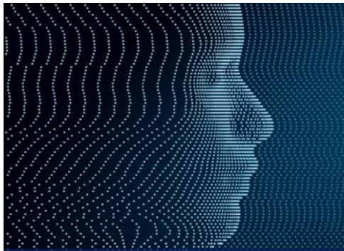
Synthetic Media – Zukunft der Content Generation? (Dez 2023)