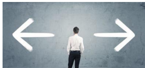
CEOs in the midst of activism (Jan - Juni 2024)