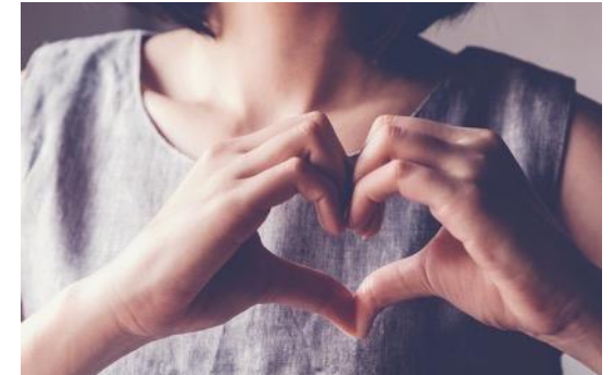
Employee Engagement & Wertschätzung (2022-Frühling 2024)