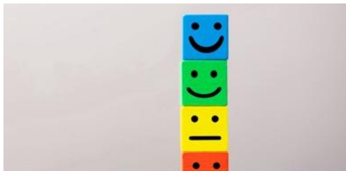
Perception and positioning of comm departments (Okt 2023- Mitte 2024)