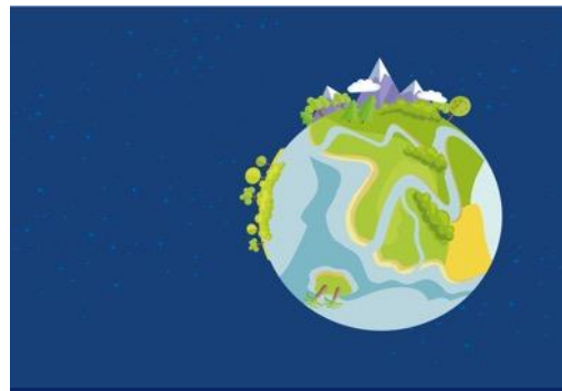
Sustainable communication departments (Mai 2023 – Anfang 2024)